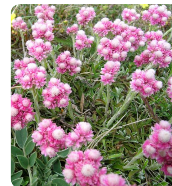
Fuktiga strandängar är populära tillhåll för många fåglar, så som tofsvipan. På sikt får vi en finare flora och fauna på de restaurerade strandängarna och i skogsbetena. Förhoppningsvis kommer kattfoten att öka igen. Den växer på torrare mark.