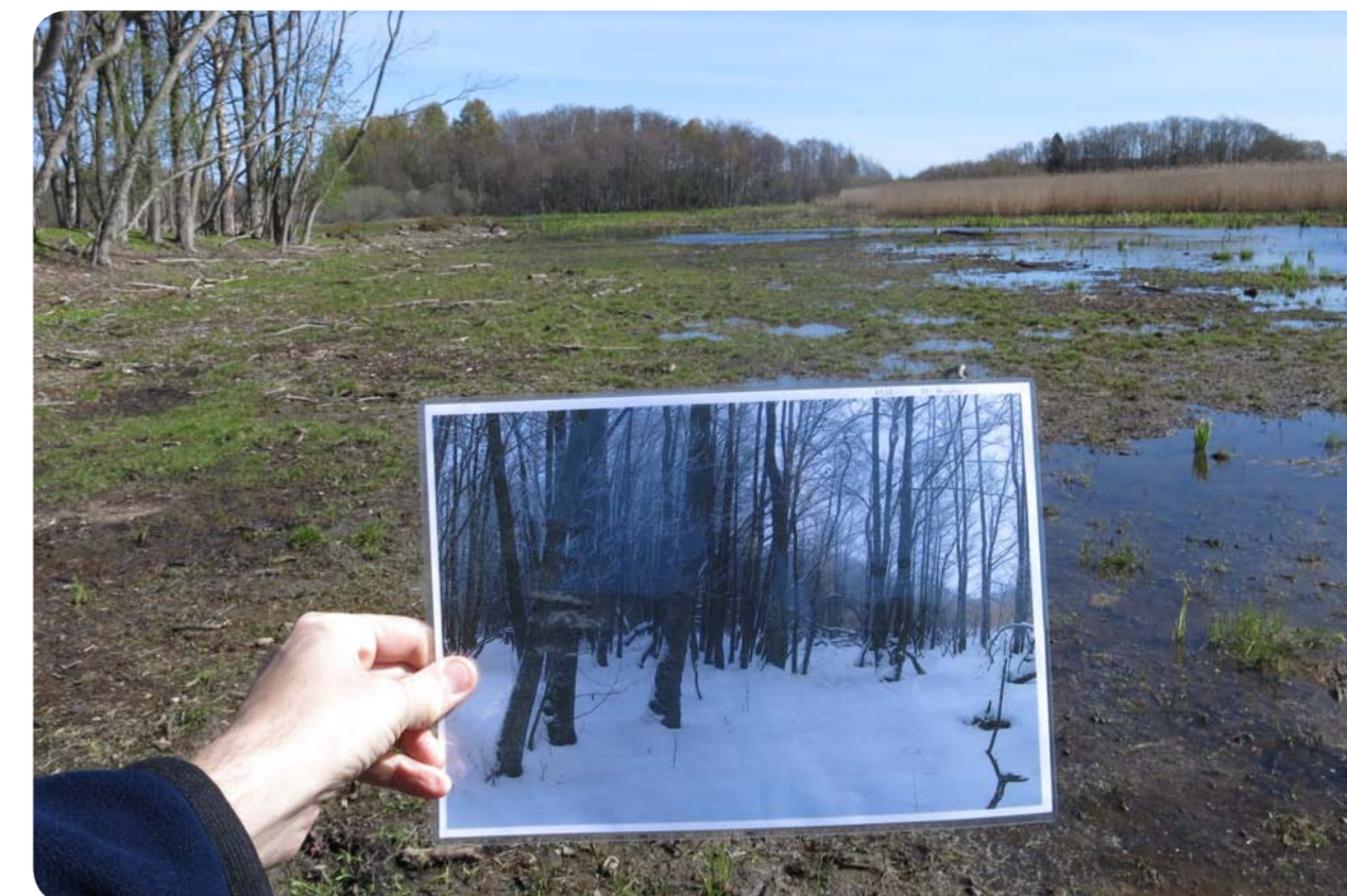
Exempel på hur det kan se ut efter att en alskog återskapats till strandäng. På våren blir den blöta marken ett tillhåll för många rastande fåglar, som till exempel tofsvipa och skogssnäppa. Foto från Askholmens naturreservat i Eskilstuna.